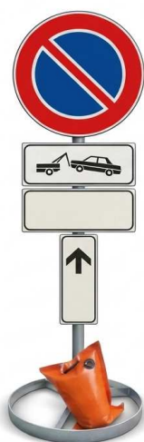
cartello di inizio divieto di sosta